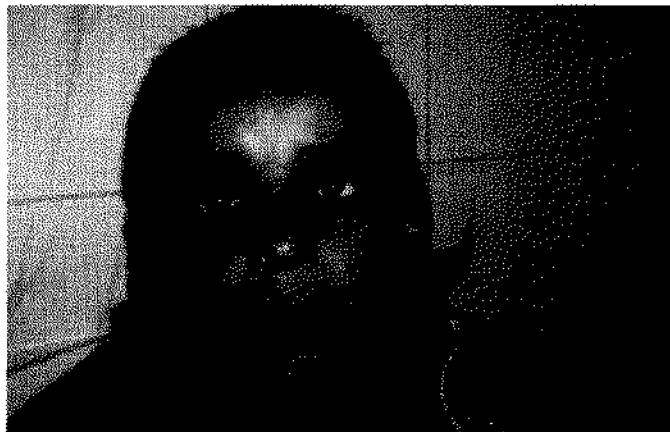
Algunos casos de catarata y estrabismo requirieron cirugía.

Los colegas que deseen colaborar con esta institución serán bienvenidos; sólo deberán ponerse en contacto de lunes a viernes de 9 a 13 horas. MO