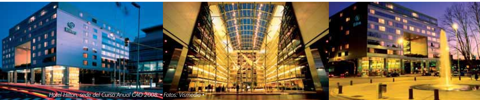
Hotel Hilton, sede del Curso Anual CAO 2008.

Curso Anual CAO 2008 Jornadas Nacionales de Oftalmología 22, 23, 24 y 25 de mayo de 2008 Hotel Hilton Macacha Güemes 351, Buenos Aires