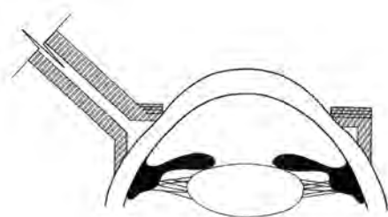
Figura 1. Coincidencia entre la cara posterior del anillo de succión con la curvatura corneal.

Por los conceptos mencionados en los párrafos anteriores se recomienda la utilización de un anillo de succión que guarde relación con la curvatura escleral del paciente sometido a LASIK miópico.